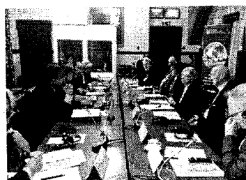
Discusión parlamentaria en mesa redonda