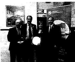
Intercambio de obsequios con el Presidente del Grupo Interparlamentario Británico