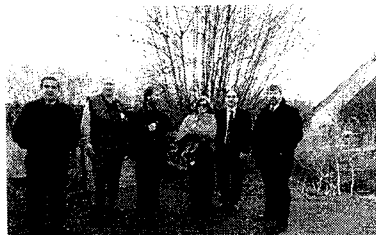
Visita al Centro de Humedales de Londres