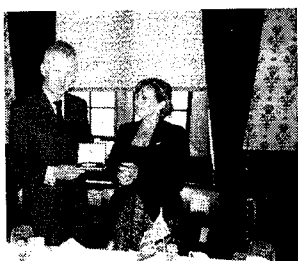
Almuerzo ofrecido por Lord Ponsonby de Shulbrede

La Delegación del Grupo Interparlamentario Uruguayo ante la Unión Interparlamentaria (UIP) realizó una visita de trabajo con el Grupo Interparlamentario Británico ante la UIP en Londres, Reino Unido, del 24 al 27 de marzo de 2014.