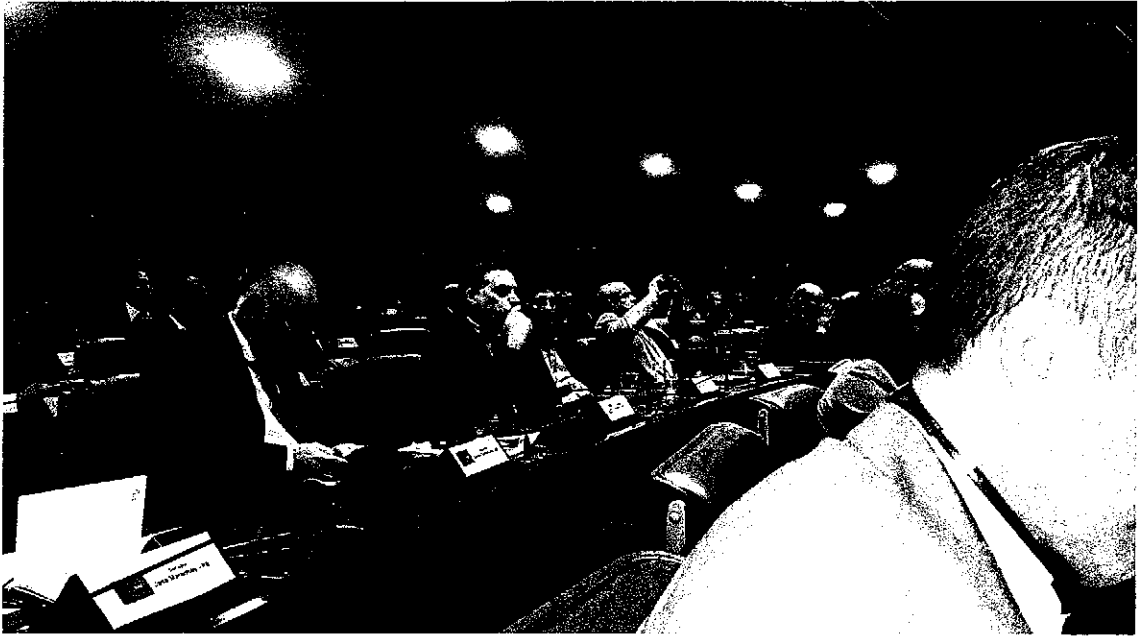
Legisladores Uruguayos en el Senado de Brasil en Brasilia en ocasión del Acto de apertura de los trabajos de las Comisiones del Parlatino el 19 de agosto de 2015.-