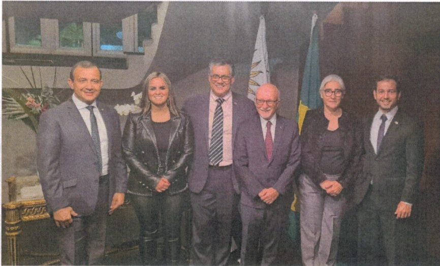
Setor Presidente de Amstol Brasil Governo Federal Gomes