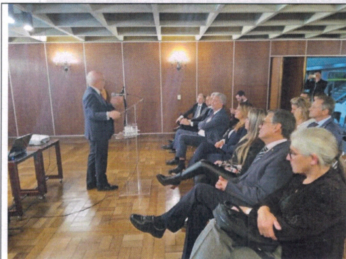
Señor Embajador de Uruguay en Brasil, Guillermo Valles