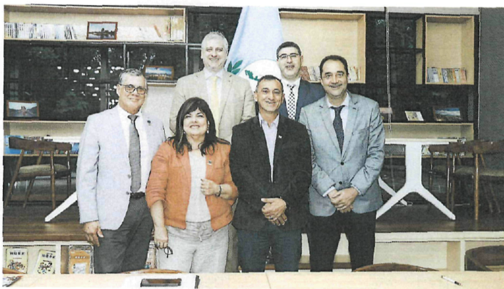
Delegación de los Representantes de los Partidos Colorado, Nacional y Frente Amplio.