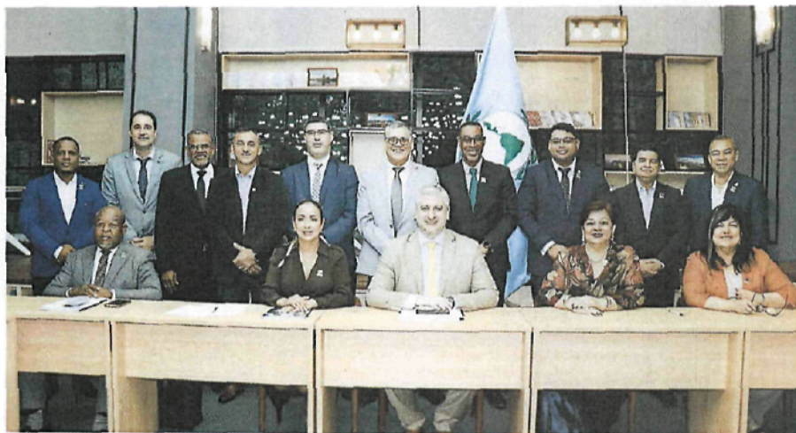
Presidencias y vicepresidencias de la Comisiones del Parlamento Latinoamericano y Caribeño

Literal P) del artículo 104 del Reglamento